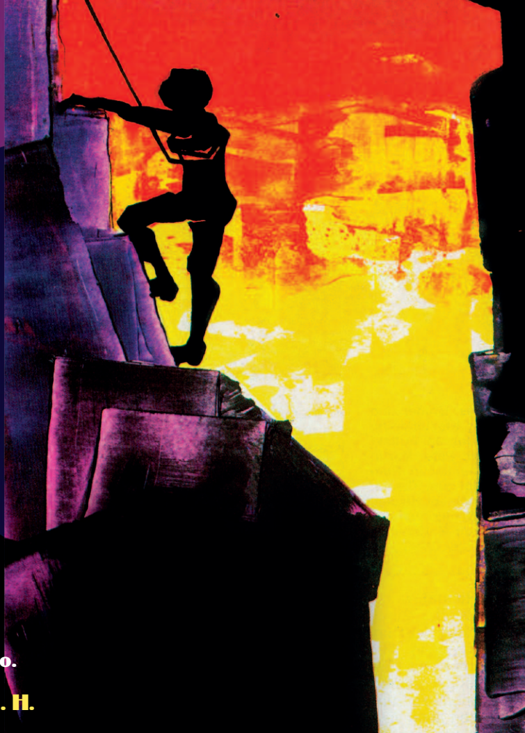
© HNA. ANTONIO MARÍA THURNHER CPS [E]